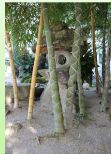
広成寿園の亀甲竹

寒さがいちばん厳しい時期。小寒から数えて15日目の大寒は、二十四節気のひとつで寒中水泳や寒稽古など、耐寒のためのいろいろな行事が行われます。またこの時期の水は「寒の水」といって、1年でいちばん雑菌が少なく長期保存に向くといわれ、酒や味噌などを仕込むのに適しています。