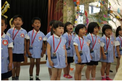
あちこちから「可愛いね～可愛いね～」の声