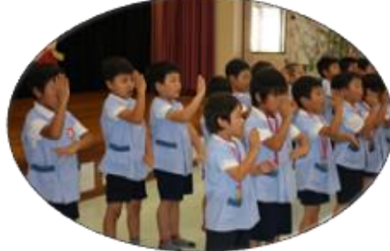
手話をしながら天使の歌声