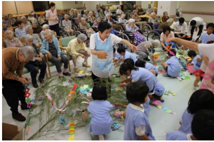
園児さんと一緒に飾りつけ