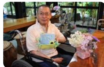
一緒に作った小物入れ、職員手作りの写真立て、花束のプレゼントでお祝した後、記念撮影