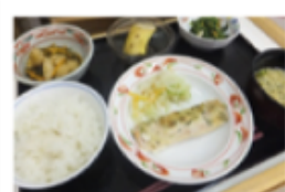
セレクトメニューのお食事