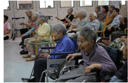
何ともいえない笑顔で聴き入られていました