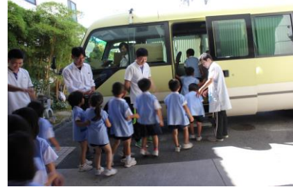
職員とハイタッチでお別れして帰途に