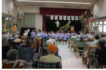
七夕飾りの後、ハーモニカ演奏と歌に感激