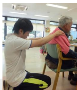
介護ケアセラピー